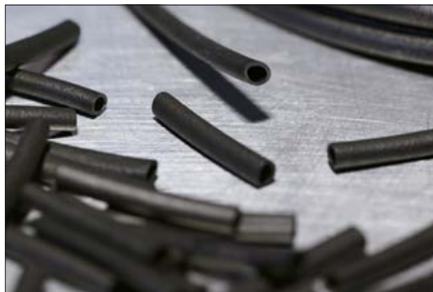
Tulejki chloroprenowe H są bardzo elastyczne oraz łatwe w montażu.