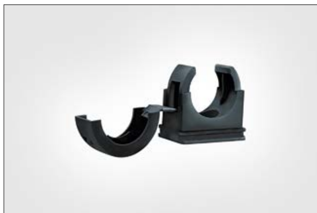
Obejma do przewodów HelaGuard PACC.